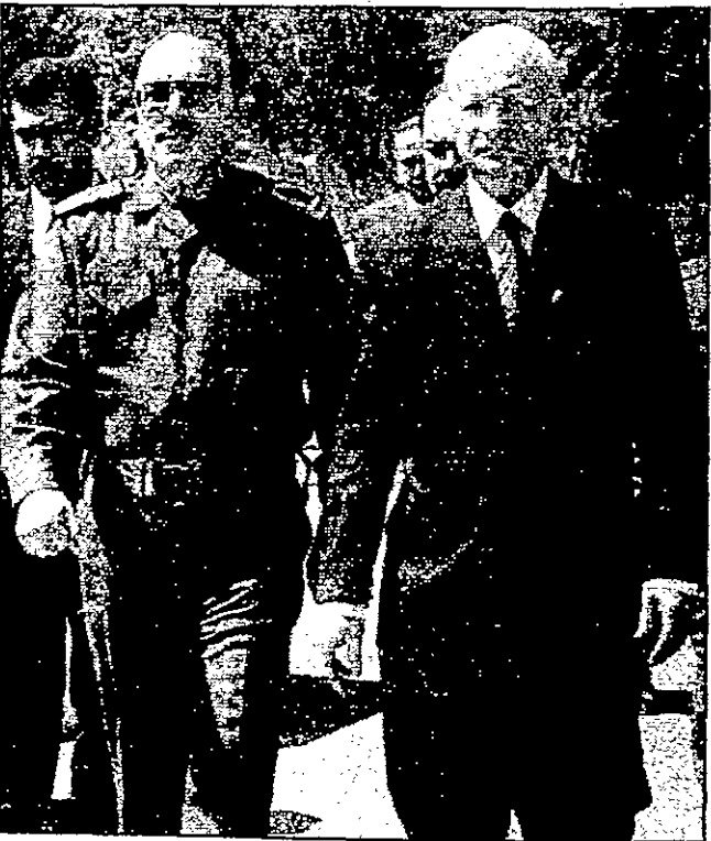
وزير الصحة السوري أياد الشطي لدى وصوله بغداد أمس حيث كان نظيره العراقي أميد مبارك في استقباله

وقال موسى للصحافيين في شرق الشيخ أن الرئيس المصري حسني مبارك سيجري محادثات مع الرئيس الفلسطيني ياسر عرفات يوم الأربعاء، وأعرب روس عن تفاؤل الأمل بالنسبة لعملية السلام اس مع انتهاء جولته دون تحقيق أي انفراج تعيد محادثات السلام إلى مسارها.